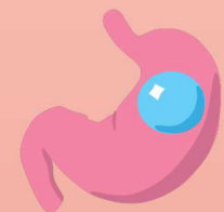
Magenballon (nicht operativ & zeitl. begrenzt)